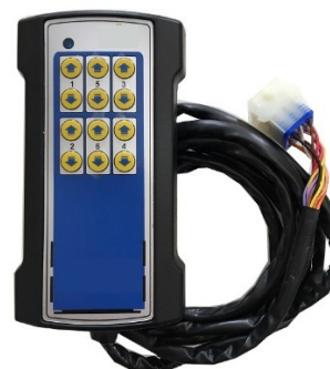
Controle de backup com fio (Opcional)