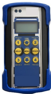
Controle remoto com display