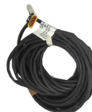
Todos os cabos incluídos