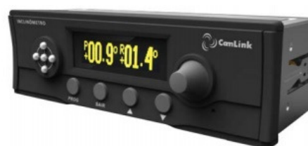
Cód. Kit com display rack