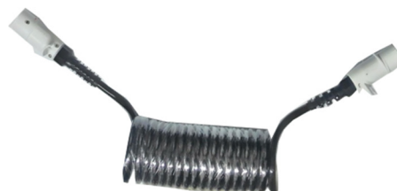
Cabos e tomadas de conexão para o semirreboque.