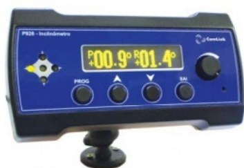
Cód. Kit com display painel