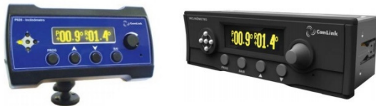
Duas opções de display