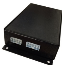
Central de alimentação