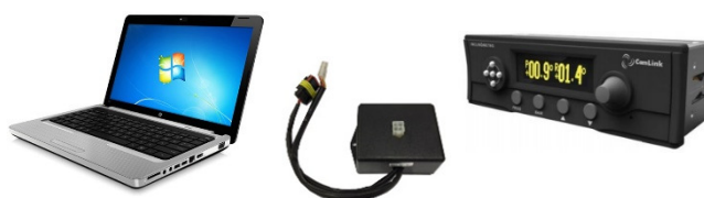
Coletor de dados por USB (opcional)